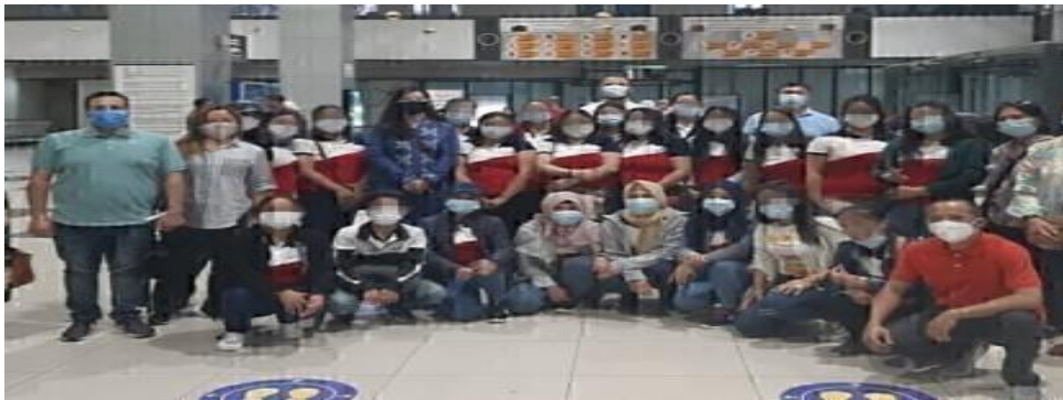
سرانجام ، بازگشت به خانه

۲۲ بازمانده از قاچاق انسان و استخدام های غیرقانونی در سوریه ف پس از مذاکرات طولانی دیپلماتیک با دولت جمهوری عربی سوریه در ۲۶ ژوئن ۲۰۲۱ وارد فیلیپین شدند. پرونده هایی علیه کار غیر قانونی کارمندان مسئول سفر این عده و قاچاقچیان انسان تشکیل شده است